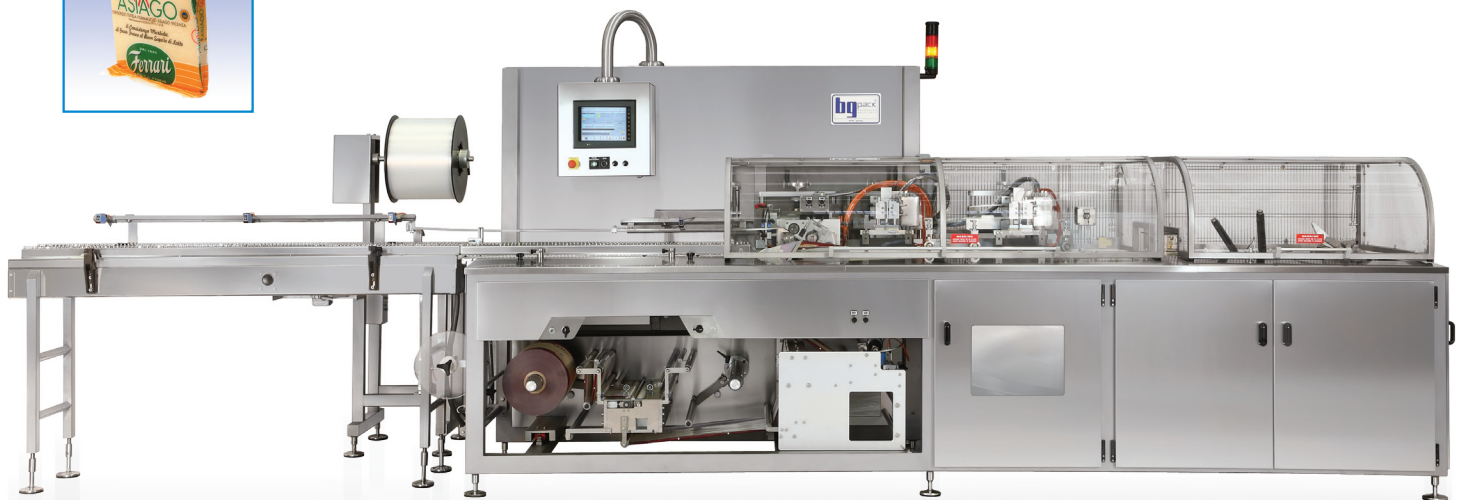
BG PACK 4800