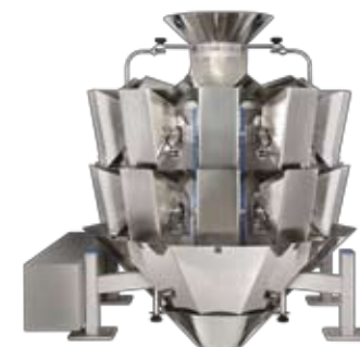
• MBP multihead weigher 10C1.