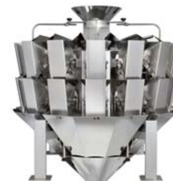
• MBP multihead weigher 14C1.